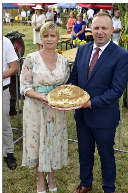
Starostwie Dożynek Gminnych 2023

Zorganizowano dziewięć konkursów związanych głównie z organizowanymi wydarzeniami – m. in. EKO-Konkurs na Dzień Ziemi, Przyjaciół planety, Powiatowy konkurs rękodzielniczy „Odzienie dla baby” w ramach roku mazurskiego, Wojewódzki Konkurs Fotograficzny „Zaułki Mazurskich miast i wsi” w dwóch kategoriach – patronat Muzeum Warmii i Mazur, IP im. Kętrzyńskiego i IPN.