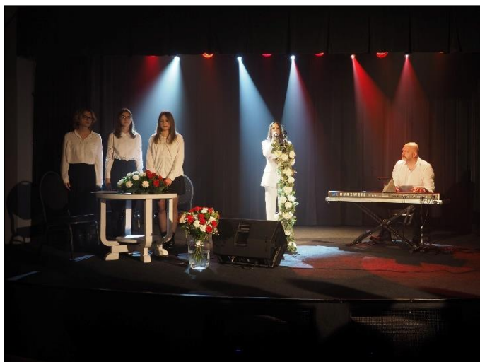
Koncert patriotyczny z okazji 11 listopada

Wydatki na zatrudnienie asystenta w roku 2023 stanowiły kwotę 44 325,55 zł (w tym środki własne 37 878,75 zł oraz dotacja rządowa w wysokości 6 446,80 zł).