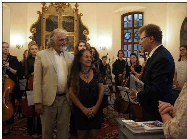
Koncert Zespołu Cellofony w Kościele Ewangelickim

Przy Gminnym Ośrodku Kultury działa Gminny Oddział Związku Emerytów, Rencistów i Inwalidów (50 osób) oraz Koło Gospodyń Wiejskich gminy Dźwierzuty (60 osób).