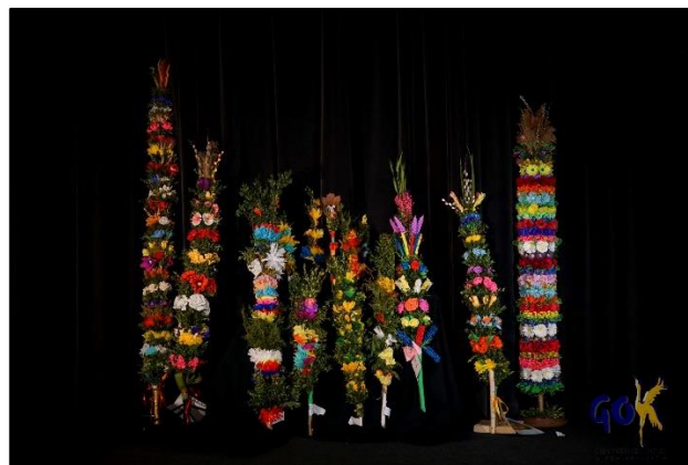
Gminny Konkurs na Tradycyjną palmę Wielkanocną

Środowiskowy Dom Samopomocy w Dźwierzutach zapewnia transport wszystkim uczestnikom z miejsca zamieszkania do ŚDS oraz z ŚDS do miejsca zamieszkania. Do dyspozycji w roku 2023 były dwa pojazdy. Jeden autobus na 20 miejsc oraz drugi - bus na 9 miejsc.