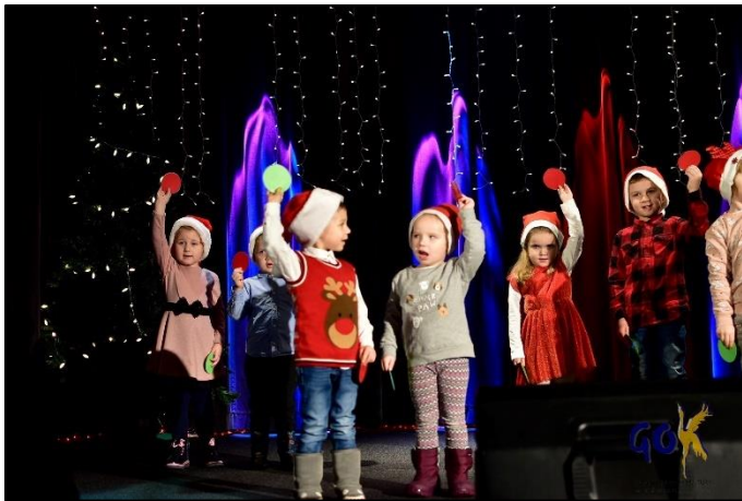
Występ przedszkolaków z Kałużyna w ramach Nakarm zwierzaka bezdomniaka

W ramach opieki nad Kołem Emerytów i Rencistów zorganizowano osiem wyjazdów m. in. Do Filharmonii Olsztyńskiej czy występów w Miejskim Domu Kultury w Szczytnie.