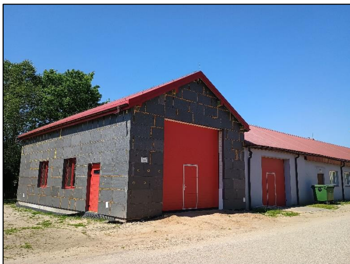
Budynek OSP w m. Nowe Kiejkuty

Największą inwestycją w 2023 roku była trwająca nadal realizacja przebudowy i rozbudowy budynku OSP Dźwierzuty wraz z budową sieci kanalizacji deszczowej. Zakończono realizację etapu I i rozpoczęto prace dotyczące etapu II, wykonano stan surowy zamknięty obiektu. Planowana realizacja Etapu II budowy nastąpi z udziałem środków własnych oraz z Rządowego Funduszu Polski Ład: Program Inwestycji Strategicznych na realizację zadań inwestycyjnych. Uzyskano dofinansowanie na poziomie 5 milionów złotych.