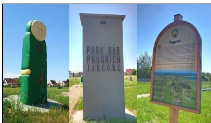
Park Bab Pruskich w Targowie

Dokument ten, zawierający ponad pięćdziesiąt stron informacji dotyczących wskaźników, celów oraz terminów realizacji wesprze rozwój i uczyni gminę bardziej atrakcyjną pod względem turystycznym, inwestycyjnym i mieszkaniowym.