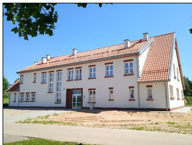
Przedszkole w Orzynch

Na rzecz Zespołu Szkolno-Przedszkolnego w Dźwierzutach pozyskano środki z Narodowego Programu Rozwoju Czytelnictwa 2.0 Priorytet 3 w wysokości 12 000,00 zł. Dla Szkoły Podstawowej w Rumach z programu Aktywna Tablica pozyskano 20 000,00 zł na rozwój szkolnej infrastruktury oraz kompetencji uczniów i nauczycieli w zakresie technologii informacyjno-komunikacyjnych. Z kolei z Rządowego Funduszu Polski Ład: Program Inwestycji Strategicznych pozyskano środki w wysokości 3 351 894,50 zł.