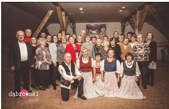
Spotkanie KGW z terenu gminy w Popowej Woli

W 2023r. na pomoc stypendialną dla 116 uczniów wydano 170 880,00 zł (w tym środki własne 17 088,00 zł).