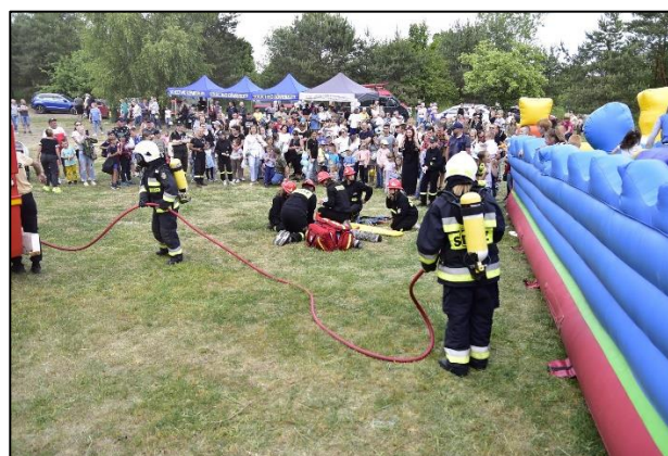
Gminne Dni Rodziny 2023 Pokaz Młodzieżowej Drużyny Pożarniczej OSP Targowo

Poprawa bezpieczeństwa to również poprawa stanu dróg. Pozyskano środki z Rządowego Funduszu Polski Ład: Program Inwestycji Strategicznych na realizację zadań inwestycyjnych na przebudowę dróg gminnych. Przedsięwzięcie przewiduje poprawę warunków bytowych mieszkańców gminy Dźwierzuty przez budowę oraz przebudowę dróg gminnych w Targowie, Jeleniowie, Grądach i Małszewku.