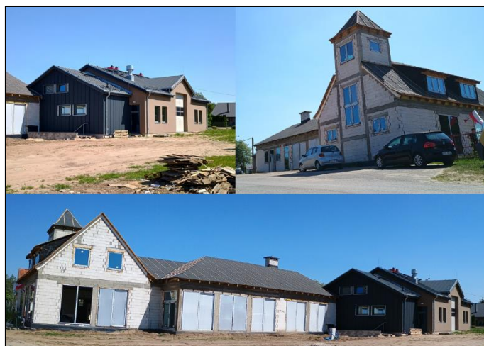
Rozbudowa budynku OSP Dźwierzuty