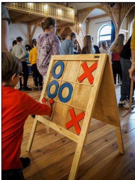
Dzień ze starymi grami w GOK dla uczniów z ZSP Dźwierzuty

Wszystkie szkoły funkcjonujące na terenie gminy przystąpiły do programu Przedsięwzięcie Ministra Edukacji i Nauki pod nazwą „Poznaj Polskę”. Zrealizowano 7 wycieczek. Uzyskano dofinansowanie w wysokości 37 799,20 zł, wkład własny w wysokości 39 331,30 zł.