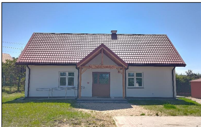
Świećlica w msc. Orzyny

W 2023 roku zostało wydanych 11 decyzji o środowiskowych uwarunkowaniach, z czego 10 dotyczyło budowy instalacji fotowoltaicznych.