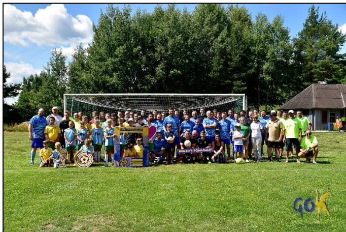
Impreza charytatywna Gramy dla Maksa

Na podstawie programu współpracy Gminy Dźwierzuty na rok 2023 z organizacjami pozarządowymi oraz podmiotami wymienionymi w art. 33 ust. 3 ustawy z dnia 24 kwietnia 2003r. o działalności pożytku publicznego i o wolontariacie ogłoszono konkurs na realizację zadań publicznych w zakresie dowożenia dzieci niepełnosprawnych zamieszkałych w Gminie Dźwierzuty do Ośrodka Rehabilitacyjno-Edukacyjno-Wychowawczego w Biskupcu. Zwycięzcą konkursu zostało Polskie Stowarzyszenie na rzecz Osób z Niepełnosprawnością