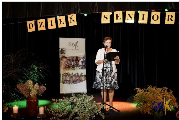
Dzień Seniora 2023

projekty konkursowe, nr konkursu RPWM.11.02.03 – IZ.00-28-001/22. Cel projektu to zwiększenie dostępu do usług społecznych w gminie wiejskiej Dźwierzuty dla 15 rodzin z dziećmi, w tym min. 8 rodzin wielodzietnych. W projekcie udział wzięło 15 rodzin (65 osób) wieloproblemowych borykających się z problemami opiekuńczo - wychowawczymi, zagrożone ubóstwem lub wykluczeniem społecznym.