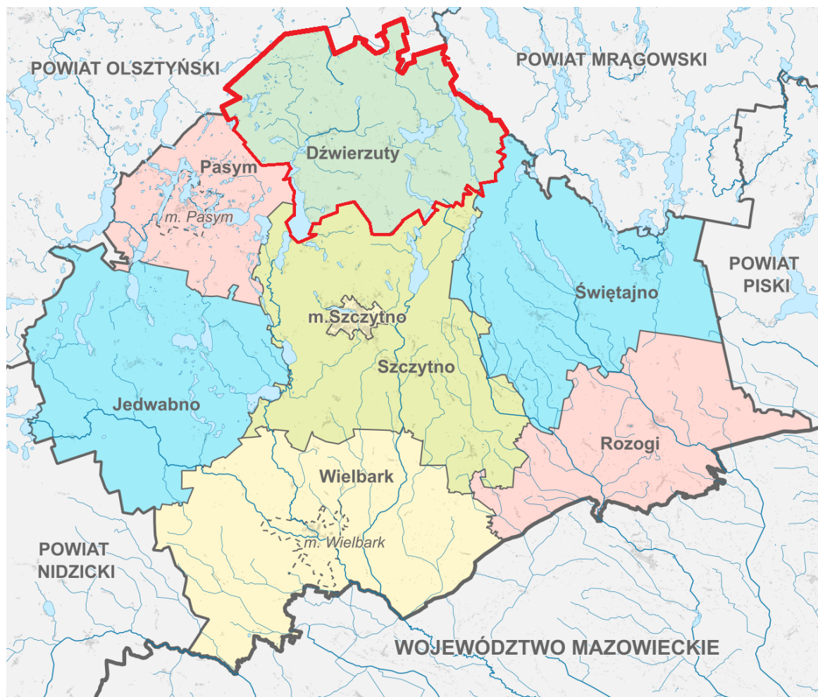
Rysunek nr 1. Gmina Dźwierzuty na tle powiatu szczycieńskiego

W odległości ok. 28 km od gminy znajduje się jedyny w województwie warmińsko-mazurskim Port Lotniczy Olsztyn – Mazury w Szymanach.